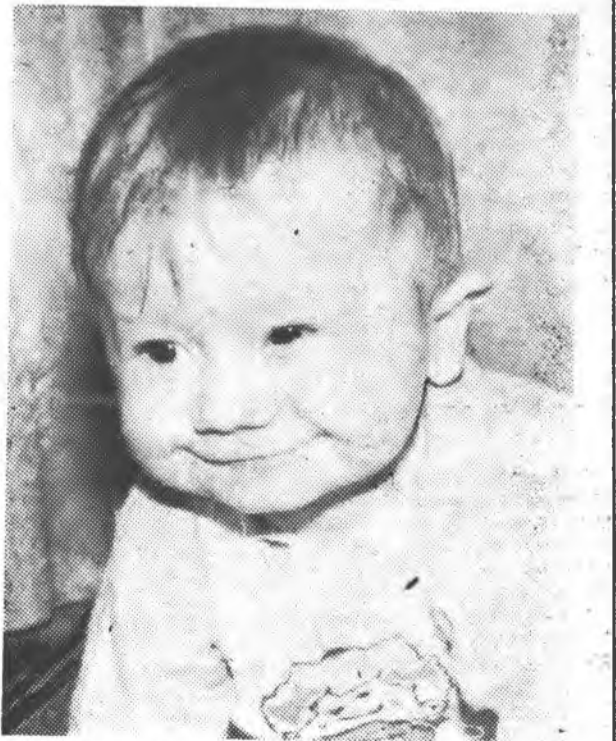
...А ось і я!